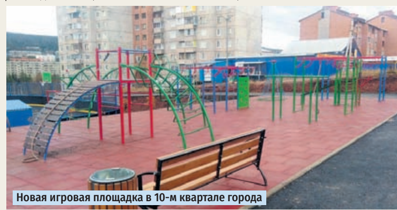
Новая игровая площадка в 10-м квартале города

С 26 апреля по 31 мая 2021 года планируется рейтинговое голосование по дизайн-проектам, призванное определить более желаемый для населения облик для зоны отдыха по адресу: Иркутская область, Нижнеилимский район, г. Железногорск-Илимский, 1 квартал, №114а, благоустройство которой планируется на 2022 год. Голосование пройдёт исключительно в электронном виде на федеральной платформе в сети интернет.